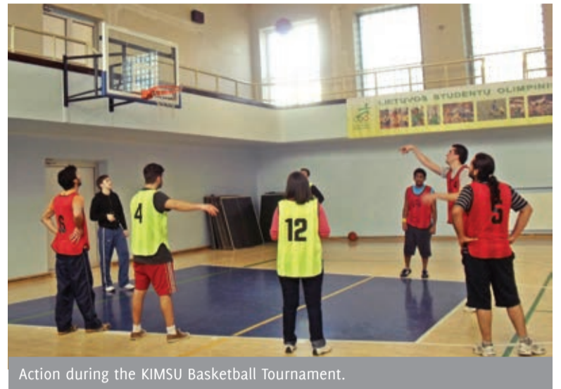
Action during the KIMSU Basketball Tournament.