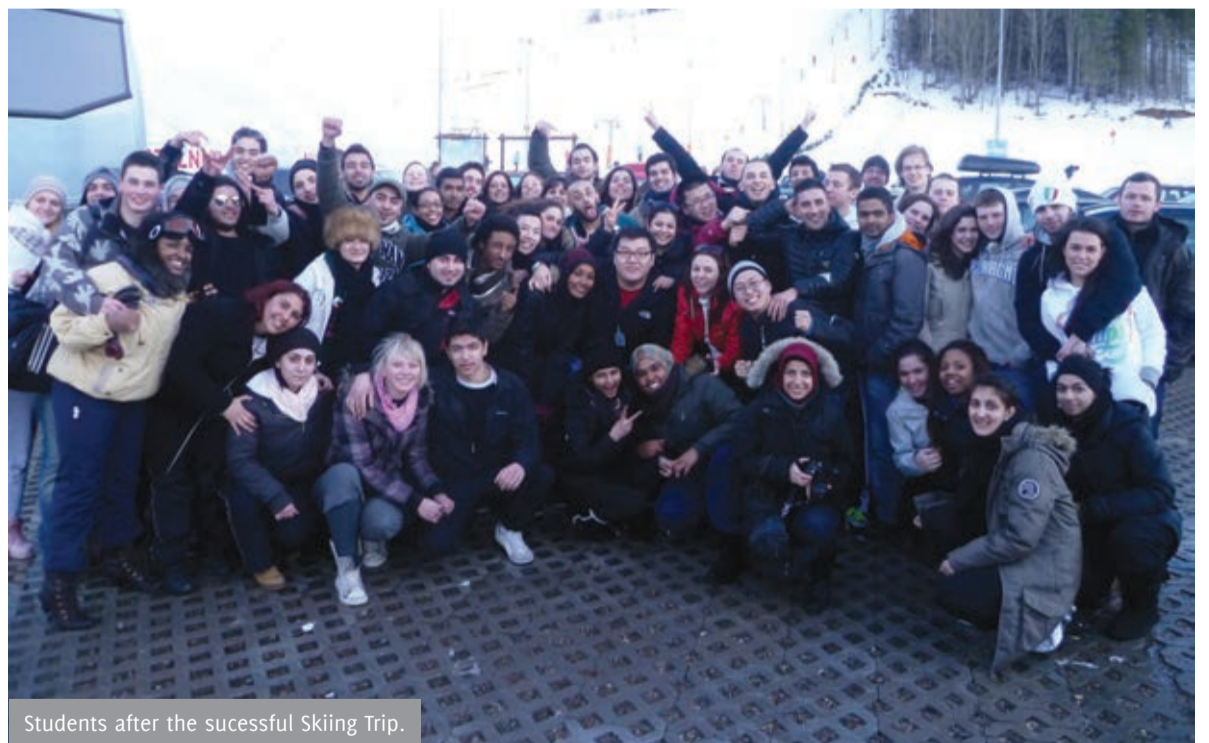
Students after the successful Skiing Trip.

Polish border to exchange currency and for some refreshments. We then proceeded to reach the resort by which time the weather had cleared, revealing a sunny day, perfect for skiing. The Resort, was more than what many were expecting, and boosted everyone's enthusiasm.