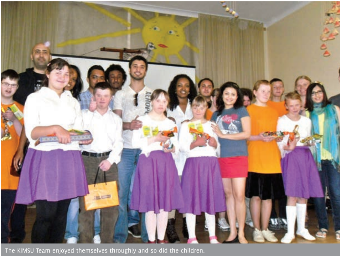
The KIMSU Team enjoyed themselves throughly and so did the children.