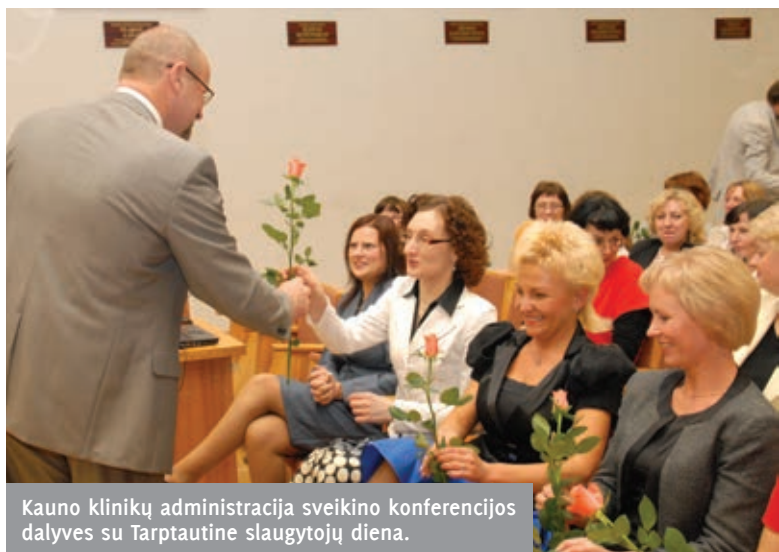
Kauno klinikų administracija sveikino konferencijos dalyves su Tarptautine slaugytojų diena.