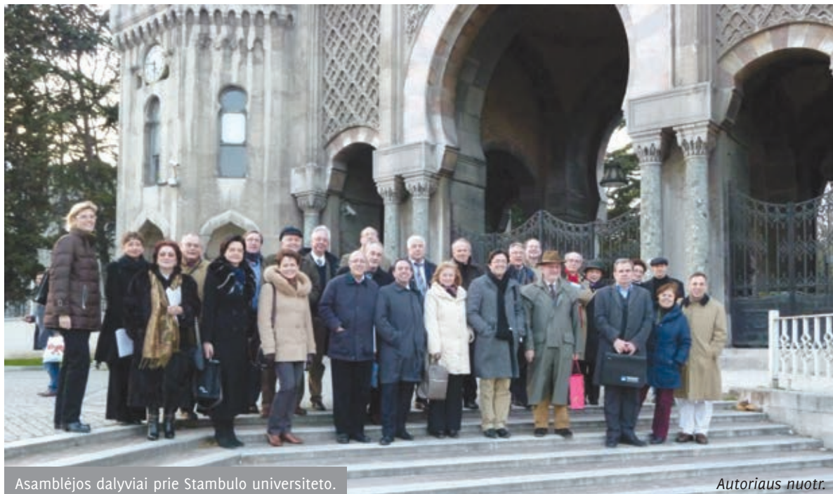
Asamblėjos dalyviai prie Stambulo universiteto.