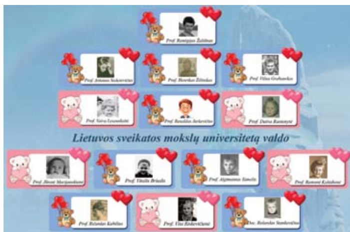
Lietuvos sveikatos mokslų universitetą valdo