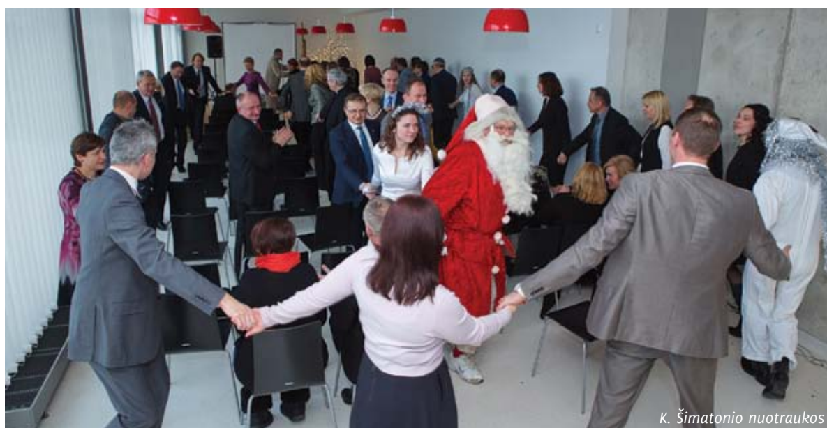
K. Šimatonio nuotraukos