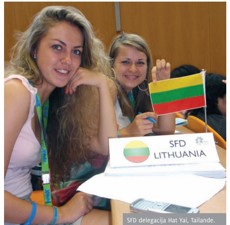
SFD delegacija Hat Yai, Tailande.

Į Studentų farmacininkų draugijos (SFD) veiklą įsitraukiau nuo pirmųjų dienų Universitete, ši draugija tapo viena svarbiausių mano veiklos sričių ir neatsiejama mano akademinio gyvenimo dalimi. ▶ 4 p.