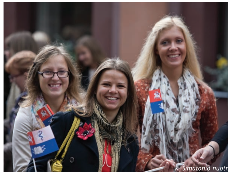
K. Šimatonio nuotr.

Rugsėjo pirmoji pasitiko visus Alma mater akademinės bendruomenės narius su naujais siekais, iššūkiais ir darbais. Šiais metais Lietuvos sveikatos mokslų universitetas Rugsėjo pirmosios šventę minėjo itin nuotaikingai ir iškilmingai. Didžiausia šventė šią dieną – pirmojo kurso studentams, su dideliu jauduliu pirmą kartą peržengusiems Universiteto slenkstį. Rugsėjo pirmosios minėjimo organizatoriai pasistengė, kad jiems ši diena būtų įsimintina.