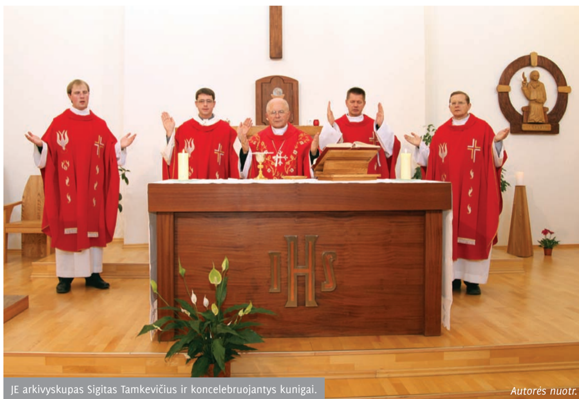
JE arkivyskupas Sigitas Tamkevičius ir koncelebruojantys kunigai.