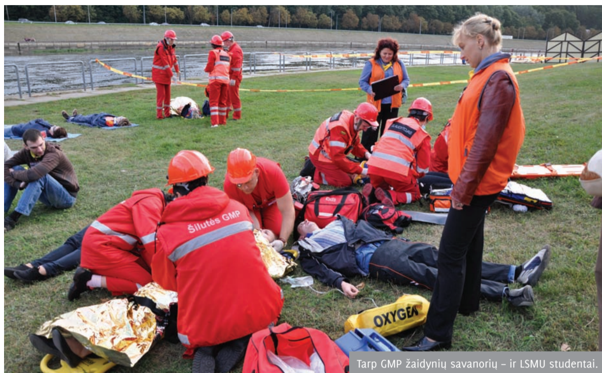
Tarp GMP žaidynių savanorių – ir LSMU studentai.