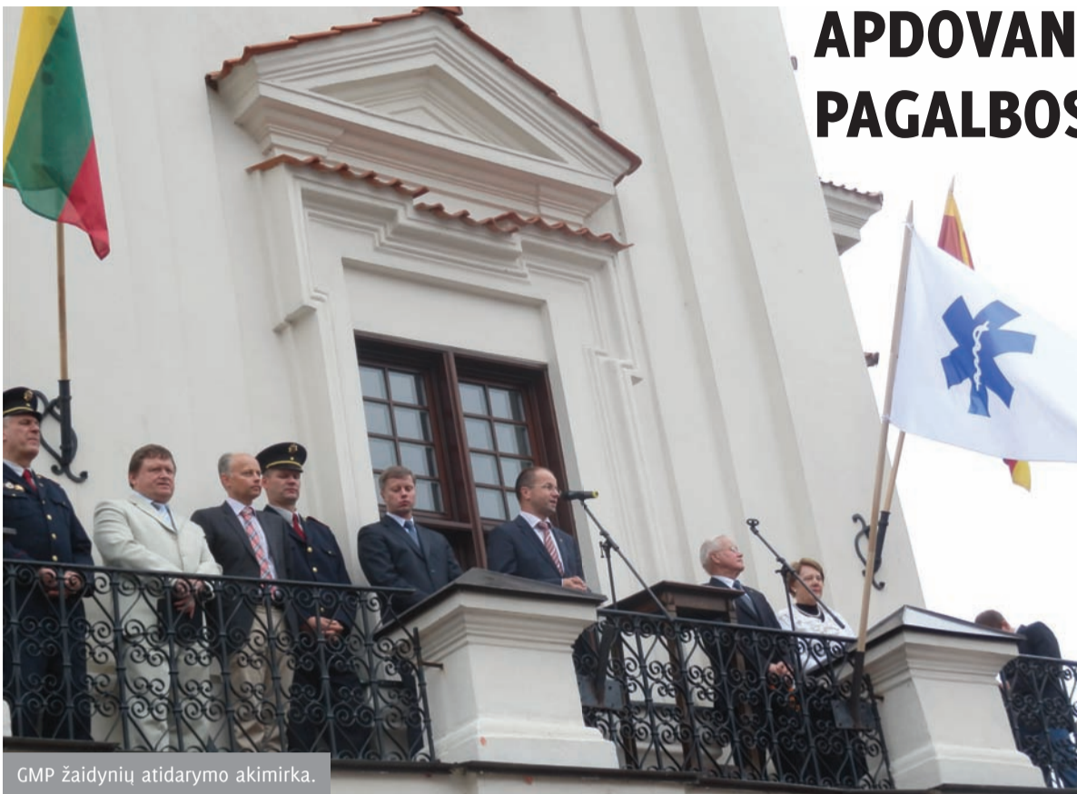
GMP žaidynių atidarymo akimirka.