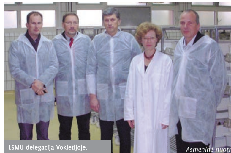
LSMU delegacija Vokietijoje.