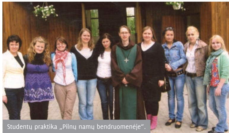
Studentų praktika „Pilnų namų bendruomenėje“.

kur geriausiai jautiesi. Kokiose praktikos vietose save gali išbandyti socialinio darbo studentas, tikriausiai įdomu jums? Sąrašas gana ilgas: Kauno „Kartų namai“, Motinos ir vaiko paramos, labdaros fondas „Aušta“, Palemono vaikų dienos centras, Vaikų gerovės centras „Pastogė“, Kauno vaiko raidos klinika „Lopšelis“, Neonatologijos klinika, Panemunės senelių namai, Gričiupio seniūnija, A. C. Patria, J. Miliaus jaunimo mokykla, Reabilitacijos klinika Neuroreabilitacijos poskyris, Kauno neįgaliojo jaunimo užimtumo centras. Tai pat praktikoje mes galime atlikti savo gimtuose miestuose ar miesteliuose esančiose institucijose, pavyzdžiui: Laukuvos miestelio seniūnijoje, Raseinių miesto seniūnijoje, Marijampolės mokykloje-darželyje „Žiburėlis“ ir t. t. Tam sudaroma puiki galimybė, jeigu tik yra poreikis. Kaip matote, būsimiems socialiniams darbuotojams atsiveria platus veiklos