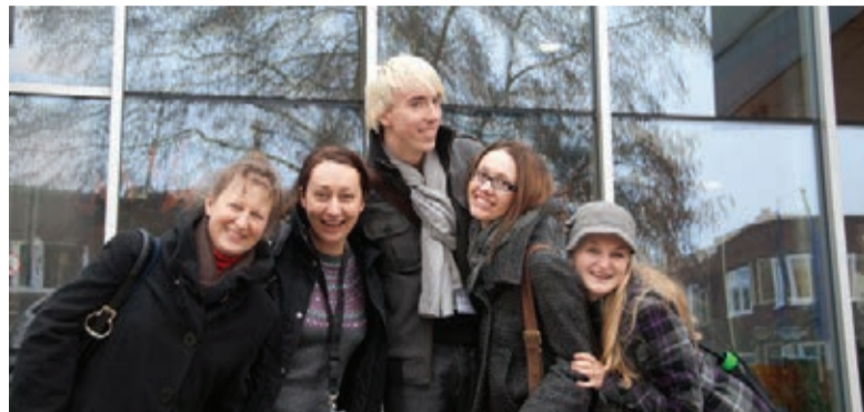
Studentai aktyviai dalyvauja tarptautinėje Erasmus programoje.

Kas gi yra tarptautinė patirtis? Socialinio darbo programa LSMU yra neatsiejama nuo šios patirties. Visi čia studijuojantys žino ar bent yra girdėję apie akademinis mainus. Universitetas siūlo net dvi puikias galimybes išvykti į kitas šalis, susipažinti su jų kultūra, sveikatos sistema ir socialinio darbo subtilybėmis.