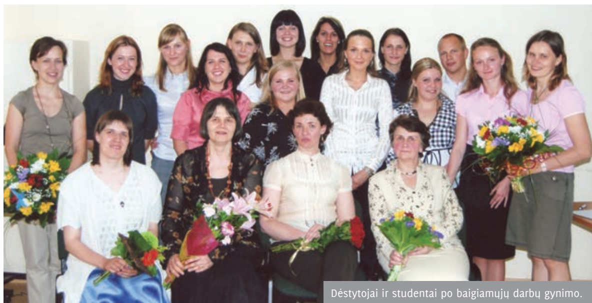
Dėstytojai ir studentai po baigiamųjų darbų gynimo.

politika. Studijų metu studentai susipažįsta su sveikatos priežiūros sistemos socialinio darbo ypatumais studijuodami ligos/negalios poveikį žmogaus, šeimos psichosocialinei gerovei, mokydamiesi stebėti, analizuoti konkrečius atvejus savo praktikos metu. Beje, apie praktiką. Studentų praktikai skiriamas ypatingas dėmesys: nuo praktikos vietos pasirinkimo iki pagalbos įgyvendiniant realius projektus. Visų studijų laikotarpiu studentams teikiamos individualios ir grupinės praktikos (supervizijos), kurių metu įgyvendinami reflektvyviojo mokymosi principai. Visi programos dėstytojai, vedantys studentų praktiką (teikiantys supervizijas), yra baigę papildomas Miunsterio akademijos (Vokietija) organizuotas dvejų metų studentų praktikos (supervizijos) studijas. Tačiau apie praktiką geriau sužinoti iš pačių studentų – jie apie tai, kaip ir apie kitus jiems svarbius dalykus, patys papasakos šiame „Ave vitos“ puslapyje. Kur ir kuo dirba programos absolventai? Baigę socialinio darbo studijas absolventai: 1) dirba tiesiogiai su klientais (pacientais) ir jų šeimomis