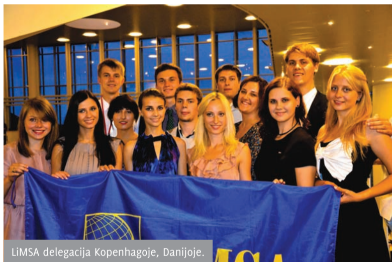
LIMSA delegacija Kopenhagoje, Danijoje.