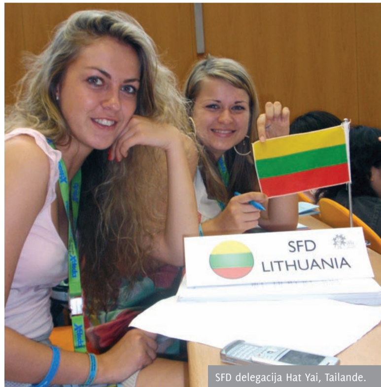
SFD delegacija Hat Yai, Tailande.

Į Studentų farmacininkų draugijos (SFD) veiklą įsitraukiau nuo pirmųjų dienų Universitete, ši draugija tapo viena svarbiausių mano veiklos sričių ir neatsiejama mano akademinio gyvenimo dalimi. ▶ 4 p.