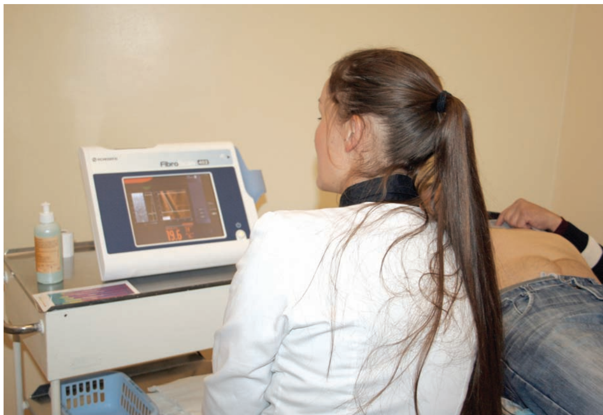
Naujuoju prietaisu „Fibroscan“ atliekami pirmieji tyrimai.