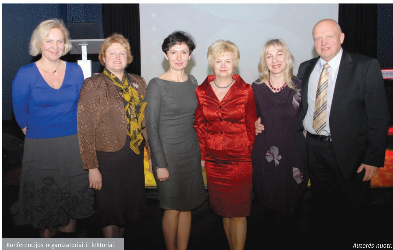
Konferencijos organizatoriai ir lektoriai.