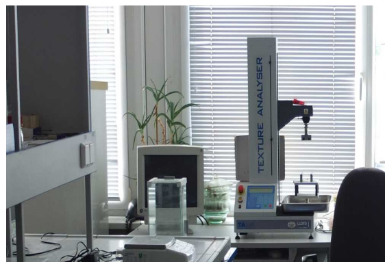
Tekstūros analizatorius „TAplus“