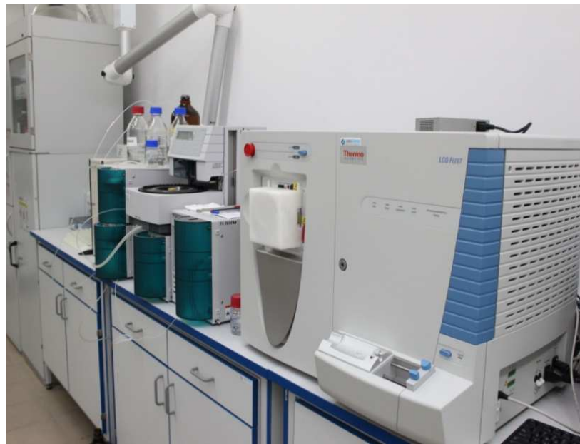
Aukšto slėgio skystinės chromatografijos (HPLC) sistema Varian ProStar (Varian Corp., USA) su UV/Vis detektoriumi Varian ProStar 325, fluorescencijos detektoriumi Varian ProStar 363 ir masių spektrometru Thermo Scientific, LCQ Fleet.