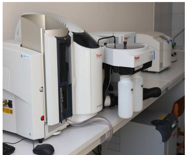
Atominės absorbcijos spektrometrinė sistema (AAS)