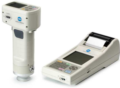
Minolta Chroma-meter CR-410 (Konica Minolta, Osaka, Japan)