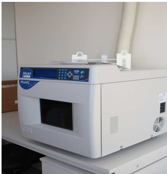
Mikrobangų mėginių mineralizavimo sistema MARSXpress