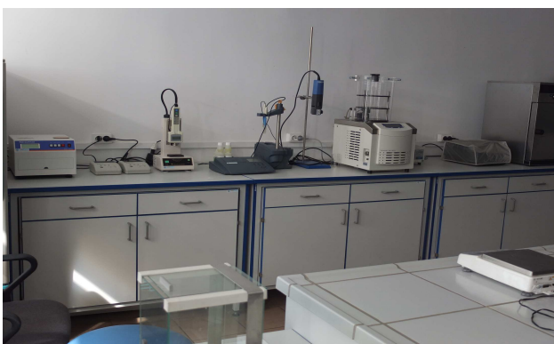
Multifunctional egg tester EMT-5200 , egg shell strength analyzer Egg Shell Force Gauge Modell-II and samples lyophilisator ALPHA 1-2 LD plus